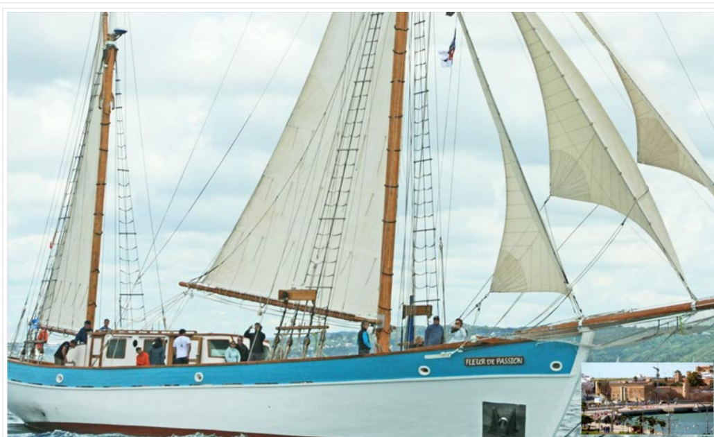
«Fleur de Passion», un voilier dédié à des expéditions scientifiques et à des projets socio-éducatifs, a jeté l'ancre dans la marina de Bouregreg.

Le voilier scientifique «Fleur de passion» porte drapeau de la Fondation suisse «Fondation Pacifique» fera escale à la marina de Bouregreg du 18 au 21 avril prochain, dans le cadre du projet «The Ocean Mapping Expedition».